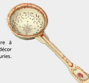
Compagnie des Indes. Cuillère à saupoudrer en porcelaine à décor polychrome de guirlandes fleuries. Époque XVIII e siècle